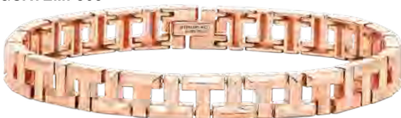
Pulseira TIFFANY & CO. no IGUATEMI 365