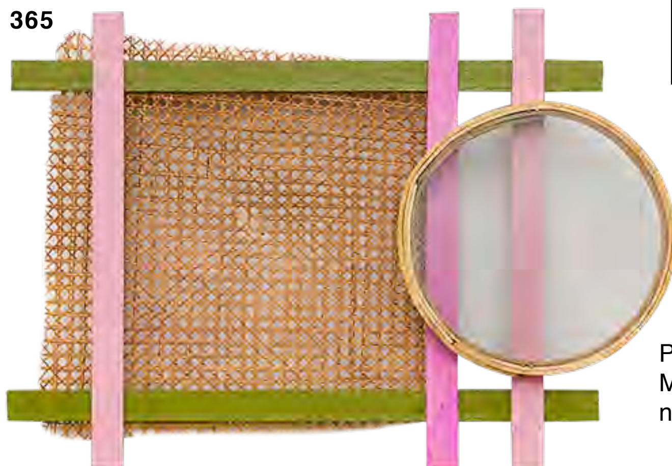
Pintura "Manga Rosa" MANO PENALVA no IGUATEMI 365