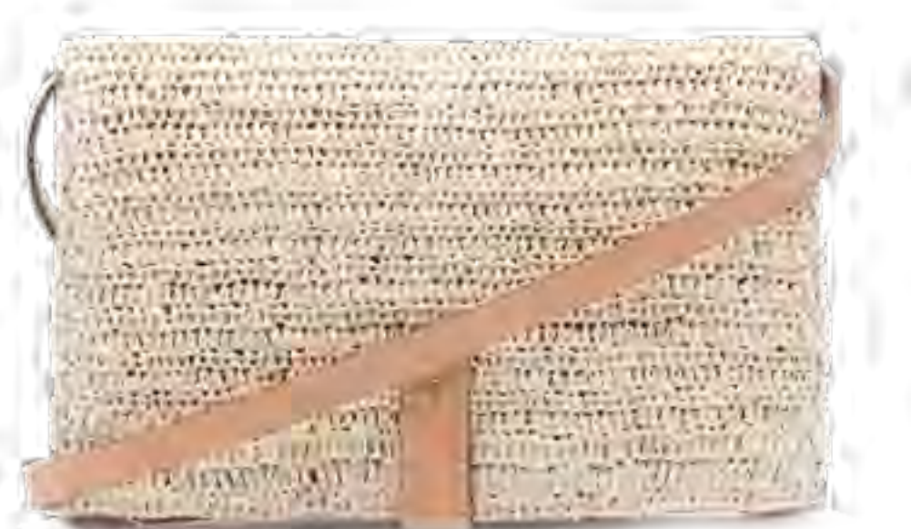
Bolsa CABANA CRAFTS no IGUATEMI 365