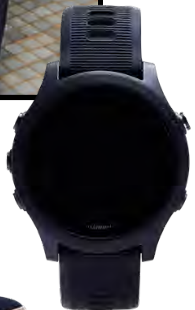
Relógio GARMIN no IGUATEMI 365