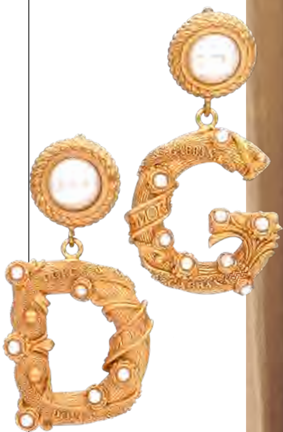
Brincos DOLCE & GABBANA no IGUATEMI 365