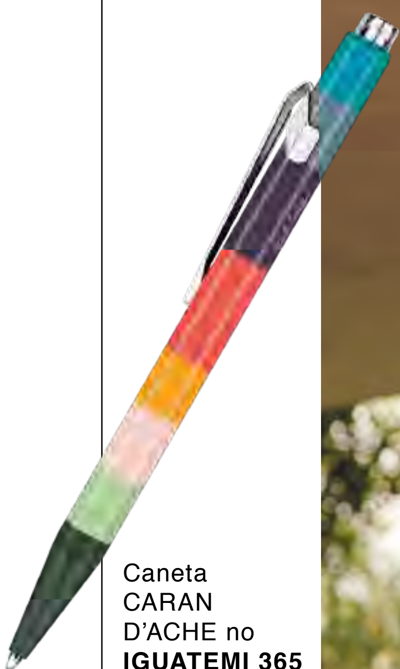
Caneta CARAN D'ACHE no IGUATEMI 365