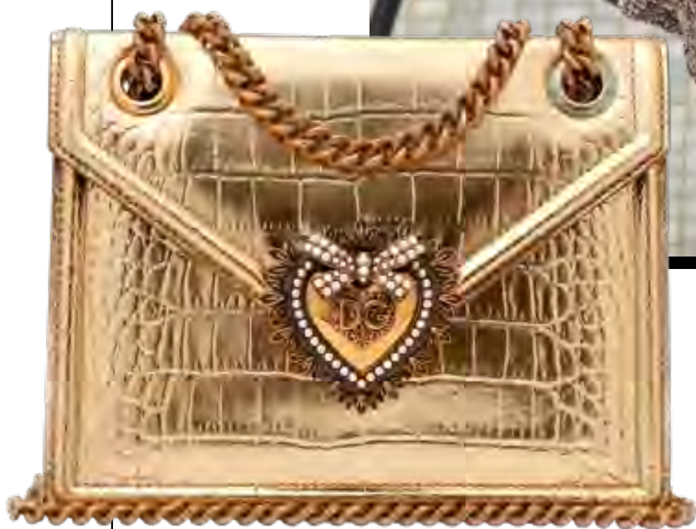
Bolsa DOLCE & GABBANA no IGUATEMI 365