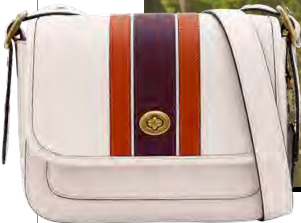
Bolsa COACH no IGUATEMI 365