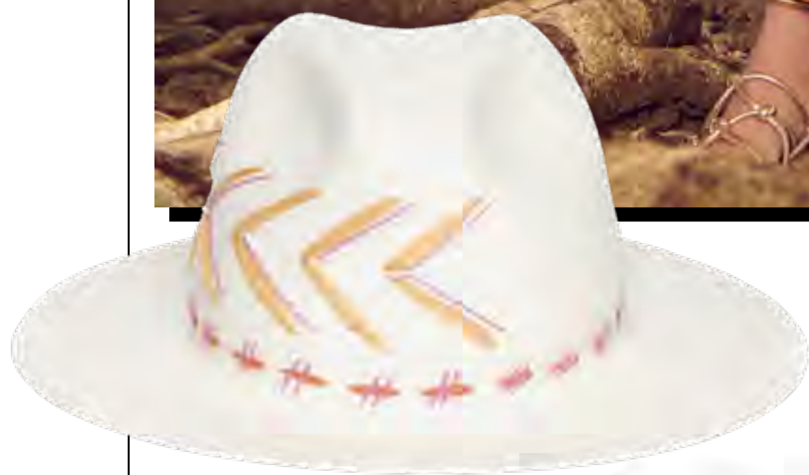
Chapéu PIREI NO CHAPÉU no IGUATEMI 365