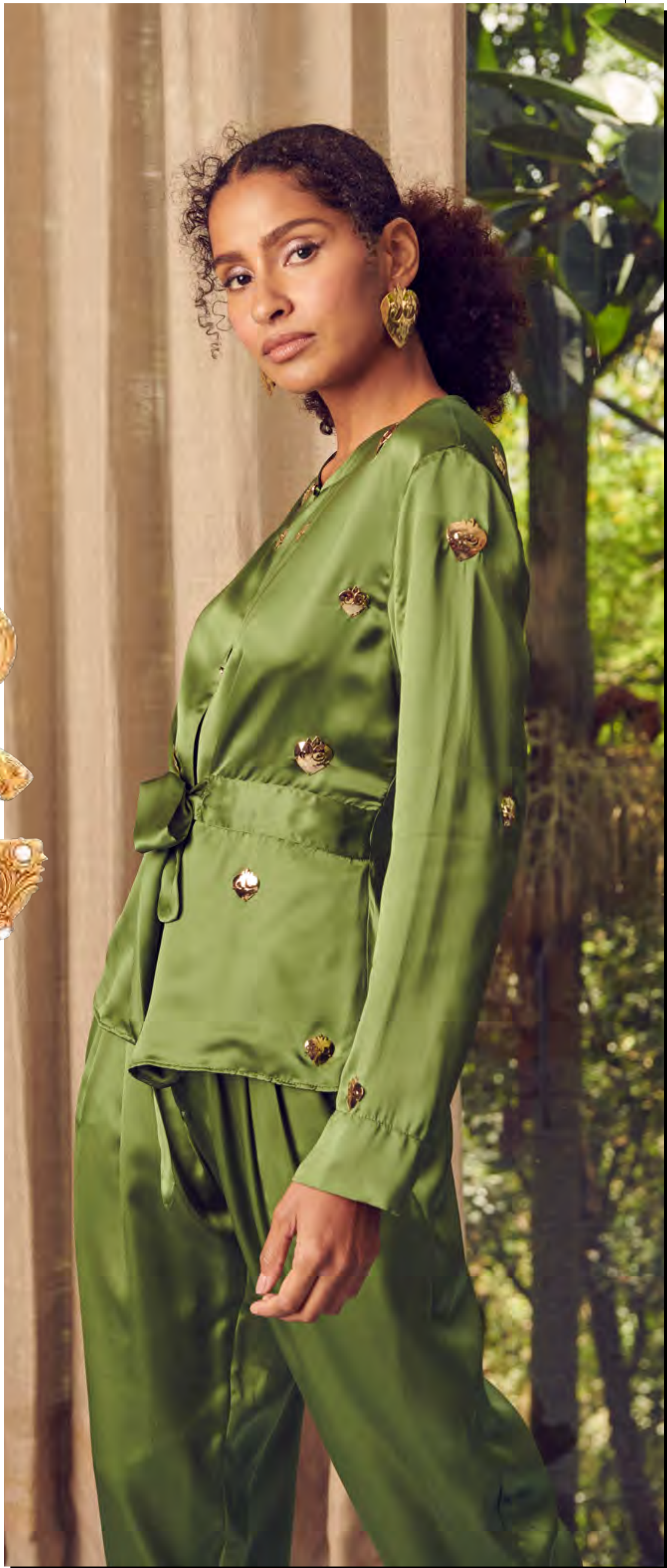
Jaqueta e calça BETINA DE LUCA no IGUATEMI SP