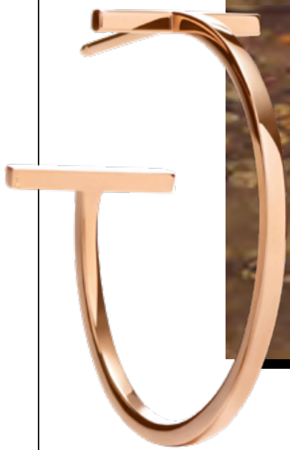
Brincos TIFFANY & CO. no IGUATEMI 365