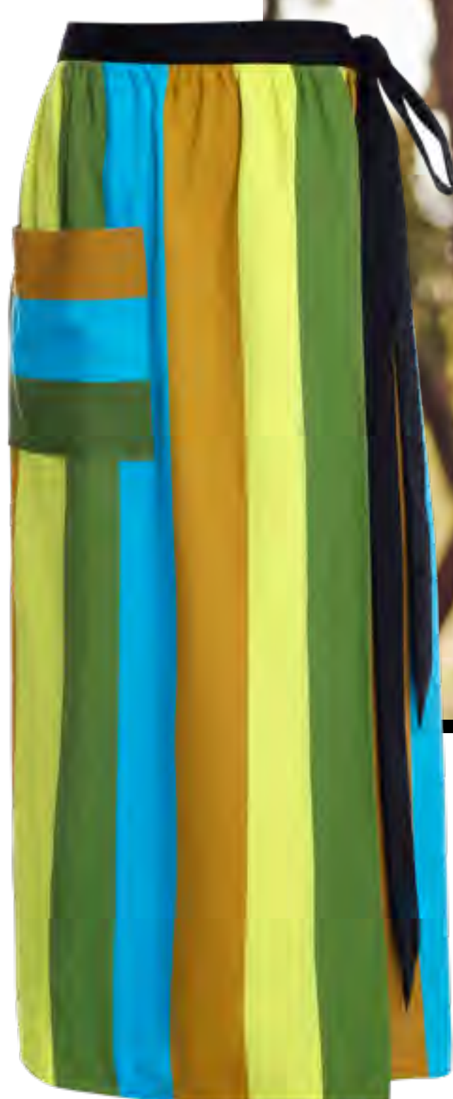
Saia ALLMOST VINTAGE no IGUATEMI 365