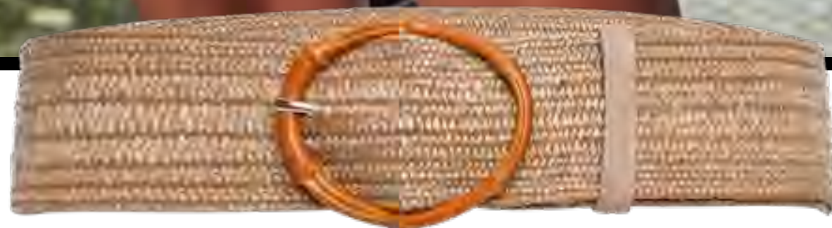
Cinto SHOULDER no IGUATEMI 365