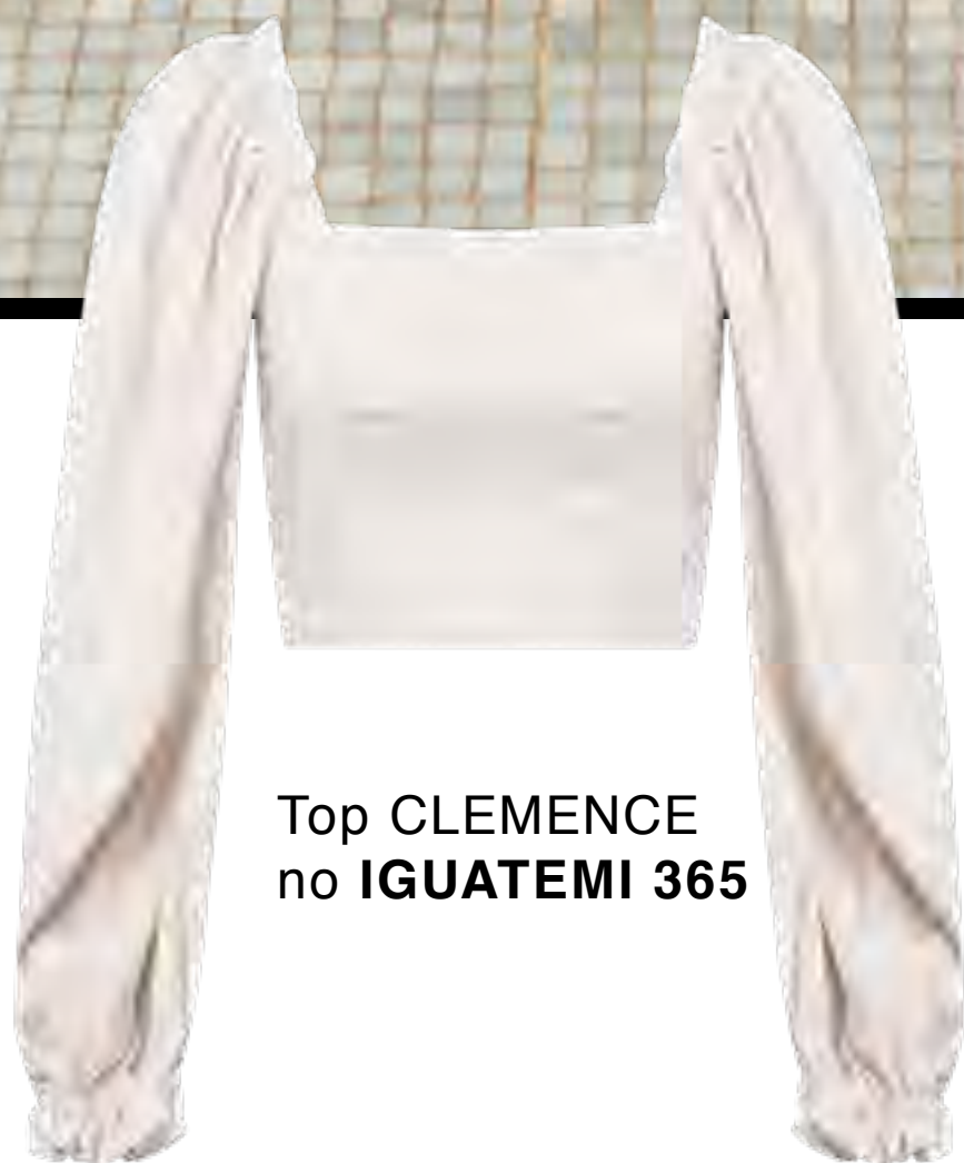
Top CLEMENCE no IGUATEMI 365