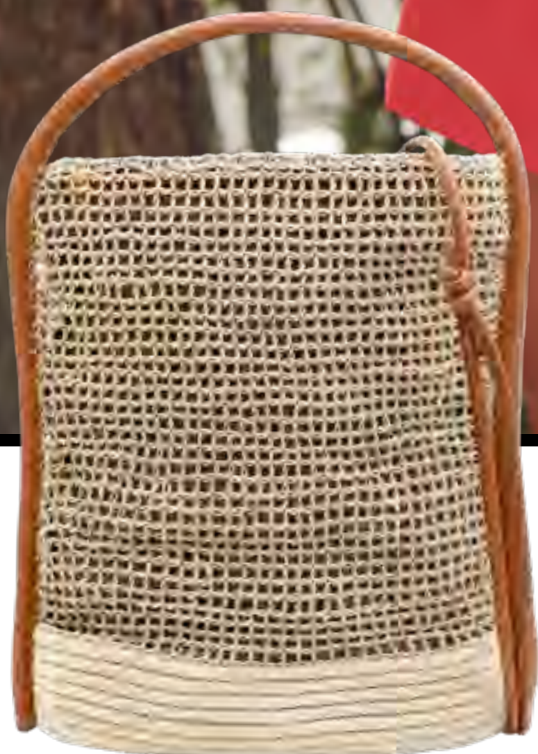
Bolsa CABANA CRAFTS no IGUATEMI 365

Maiô, jaqueta e bolsa LENNY NIEMEYER no ▶ IGUATEMI SP