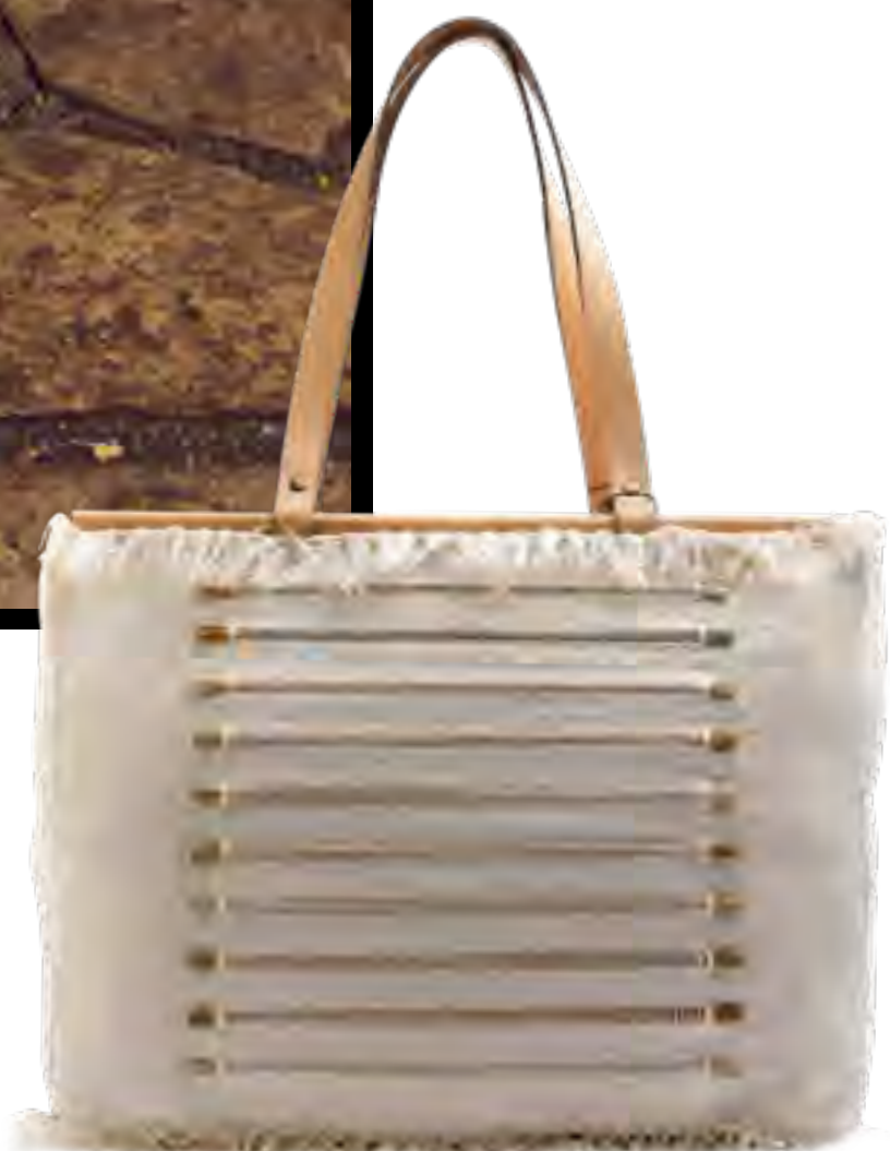
Bolsa CABANA CRAFTS no IGUATEMI 365