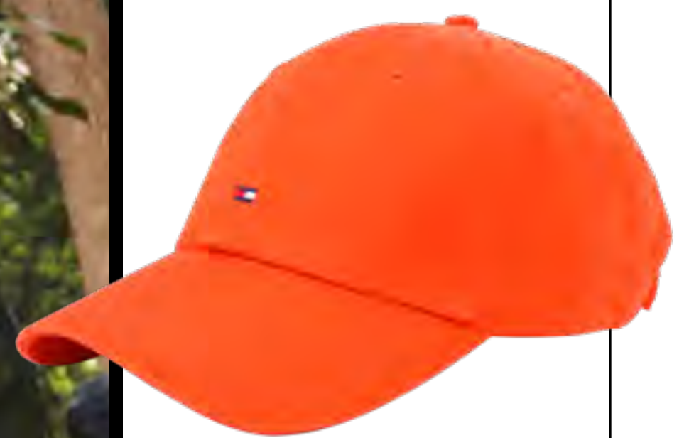
Boné TOMMY HILFIGER no IGUATEMI 365