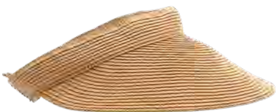
Viseira LE LIS BLANC no IGUATEMI 365