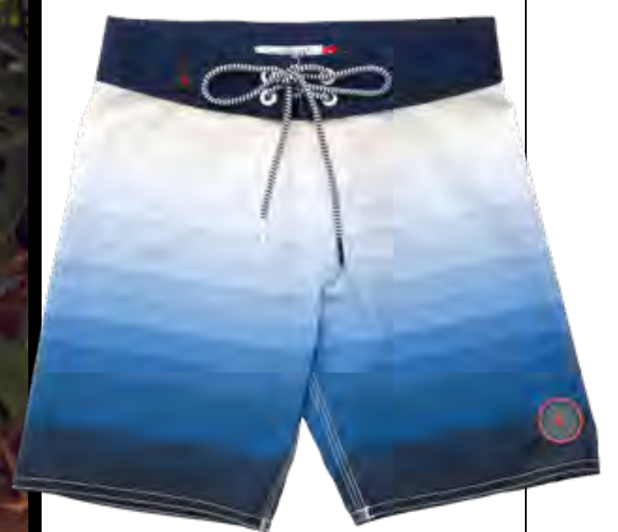
Bermuda RESERVA MINI no IGUATEMI 365

Camisa VILEBREQUIN, shorts POLO RALPH LAUREN e sandálias BIRKENSTOCK, tudo no IGUATEMI 365