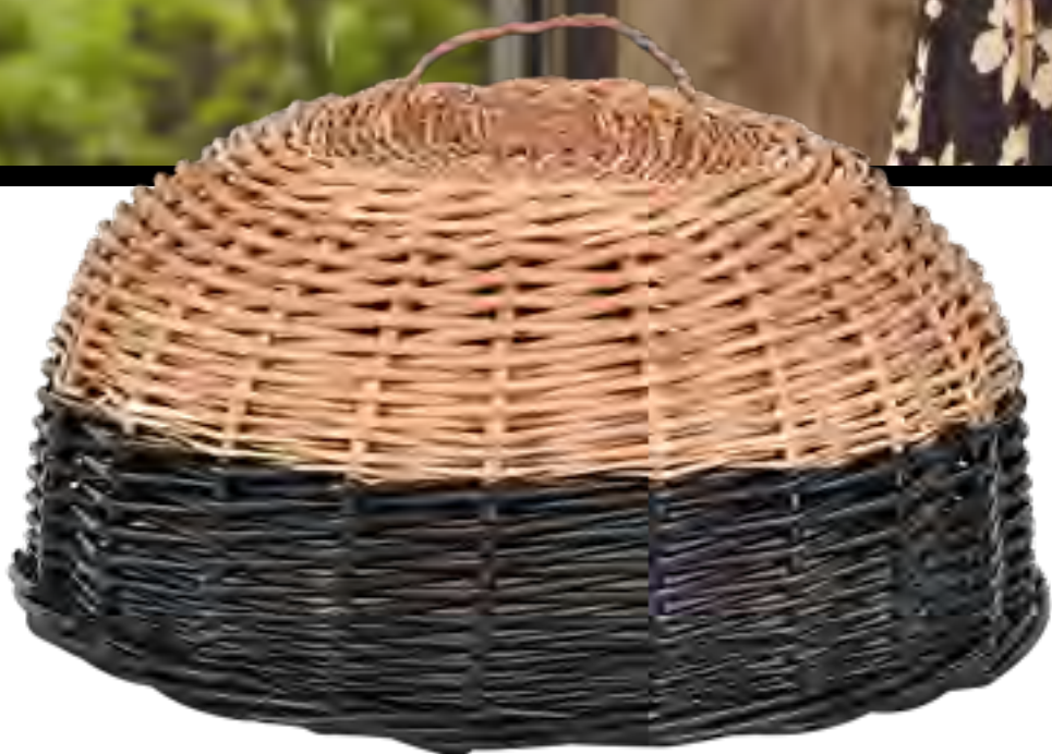
Cobre bolo ENTREPOSTO no IGUATEMI 365

Top SOLD OUT NYC e saia LE LIS BLANC , ambos no IGUATEMI 365