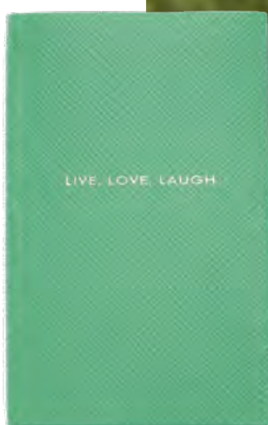
Caderno SMYTHSON no IGUATEMI 365