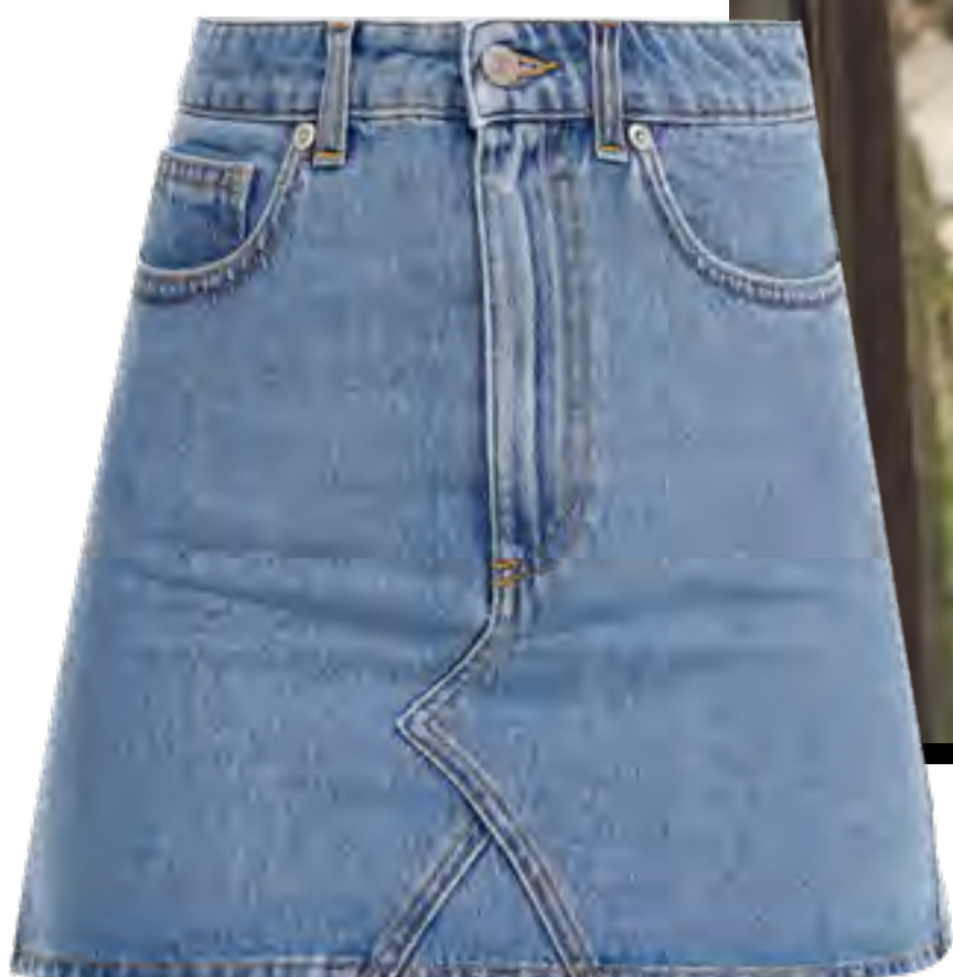
Saia CHIARA FERRAGNI no IGUATEMI 365