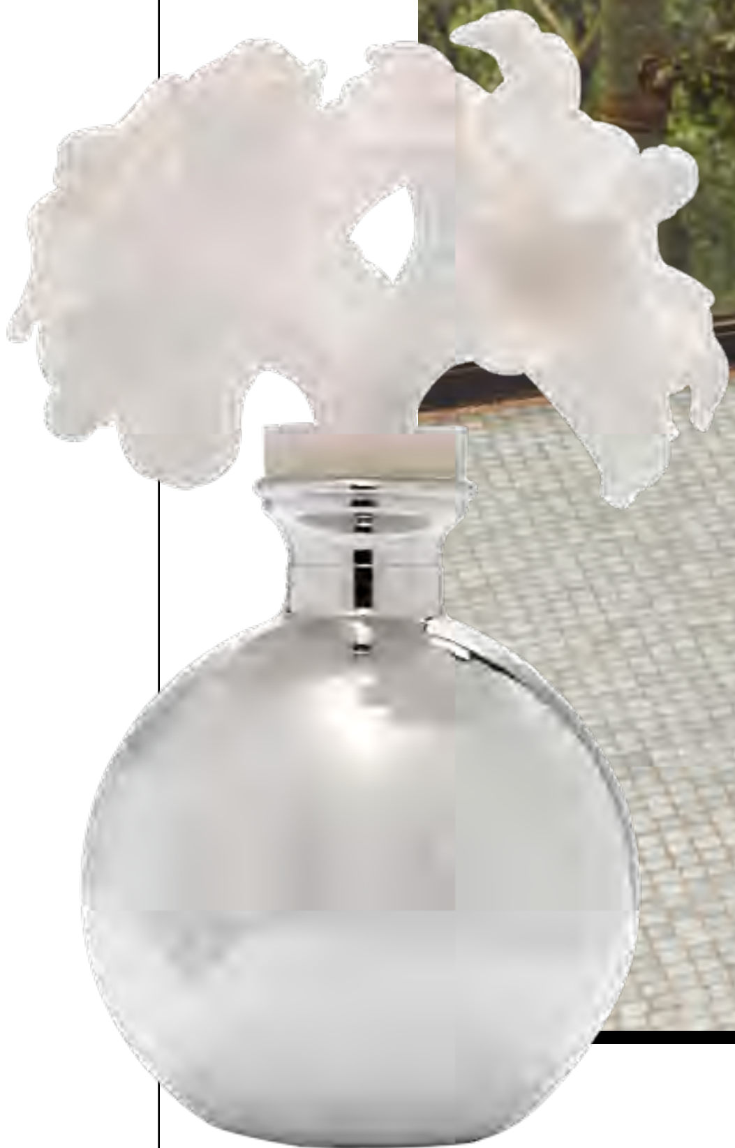
Difusor TANIA BULHÕES no IGUATEMI 365