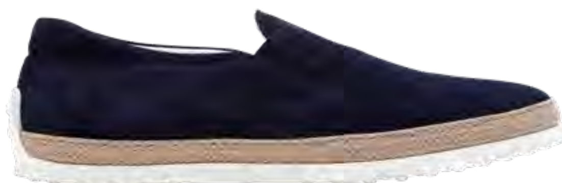
Sapato UGG no IGUATEMI 365

Camiseta e calça VILEBREQUIN e tênis CARIUMA, tudo no JK IGUATEMI