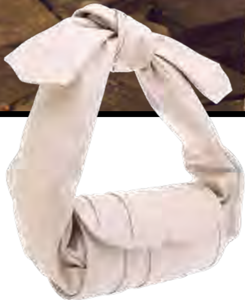
Bolsa SOLEAH no IGUATEMI 365