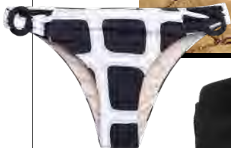
Biquíni LINNEN no IGUATEMI 365