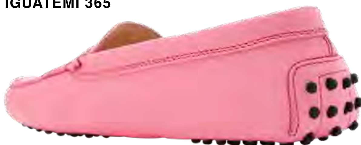
Sapato TOD'S no IGUATEMI 365