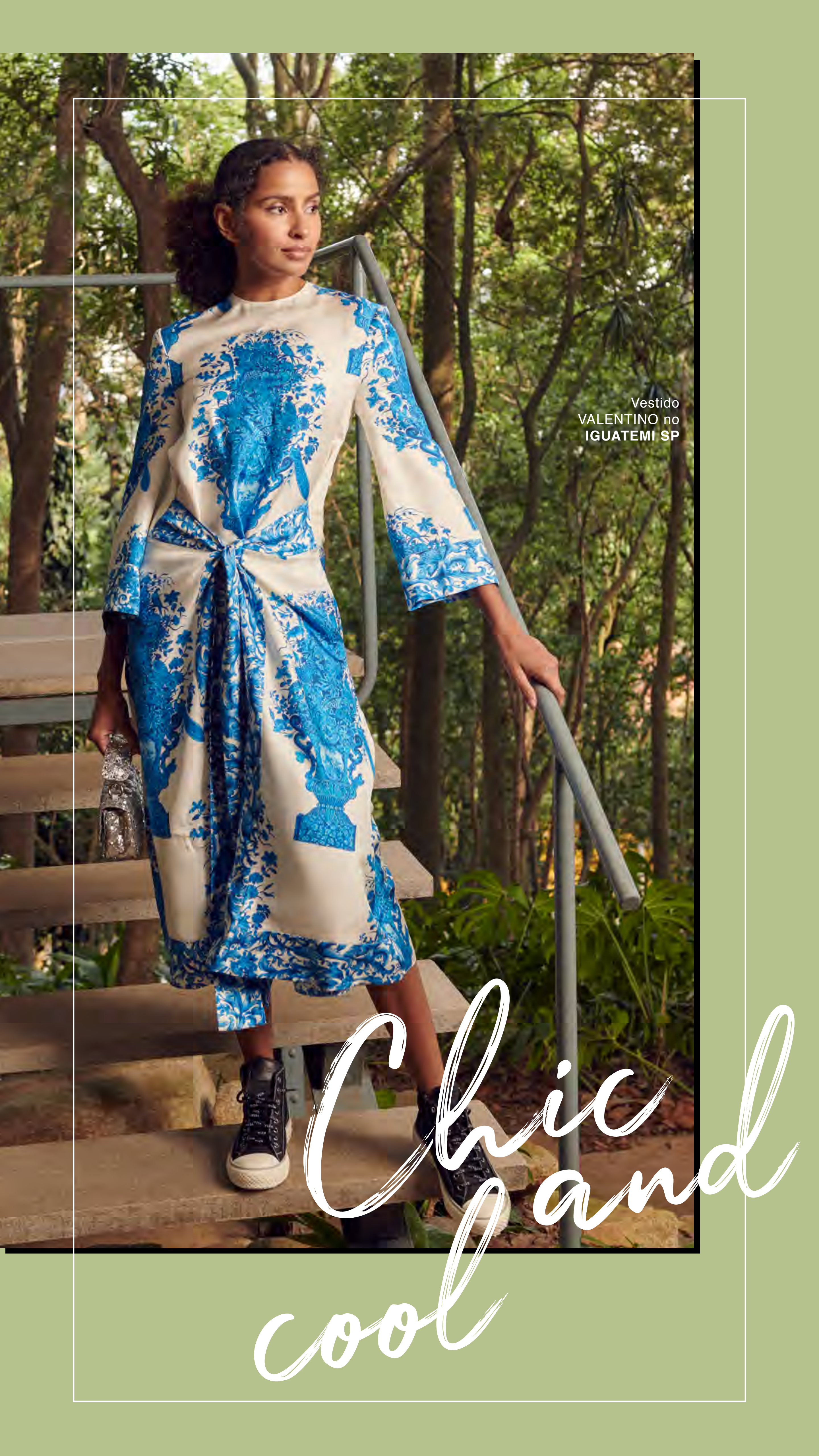
Vestido VALENTINO no IGUATEMI SP