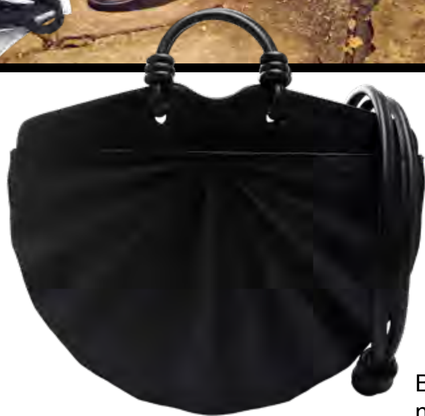
Bolsa SOLEAH no IGUATEMI 365