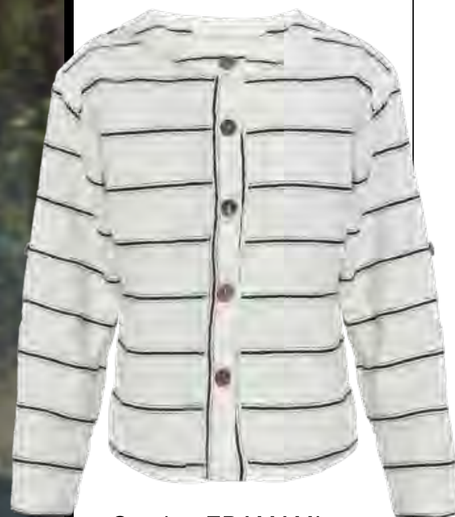
Camisa EDAMAMI no IGUATEMI 365

Calça, lenço e cardigan MAX MARA no IGUATEMI SP