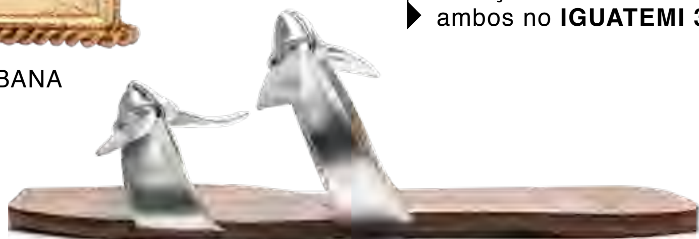
Sandálias ALEXANDRE BIRMAN no JK IGUATEMI

Moletom SOLD OUT NYC e calça LE LIS BLANC , ambos no IGUATEMI 365