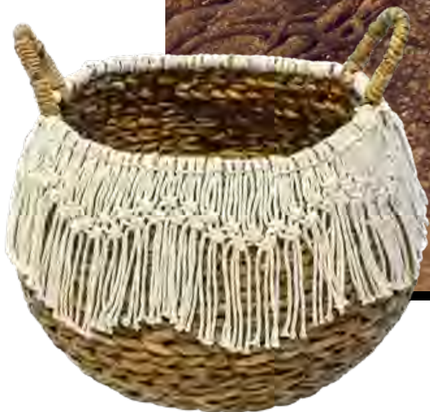
Cesta VIC MEIRELLES no IGUATEMI 365