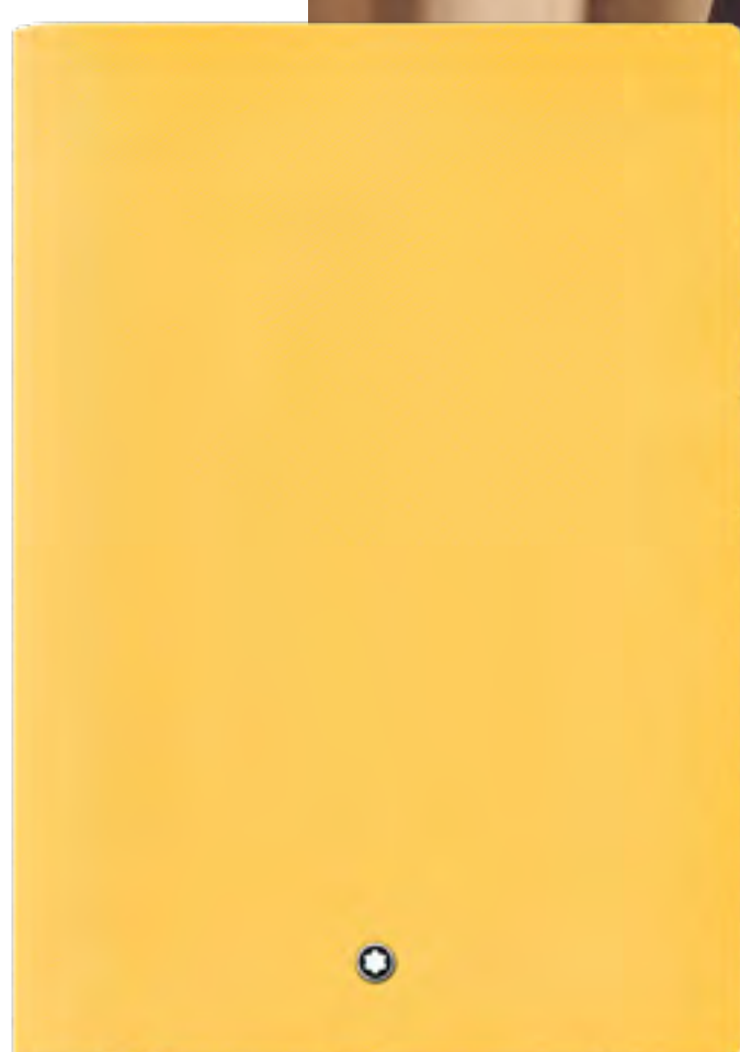
Caderno MONTBLANC no IGUATEMI 365