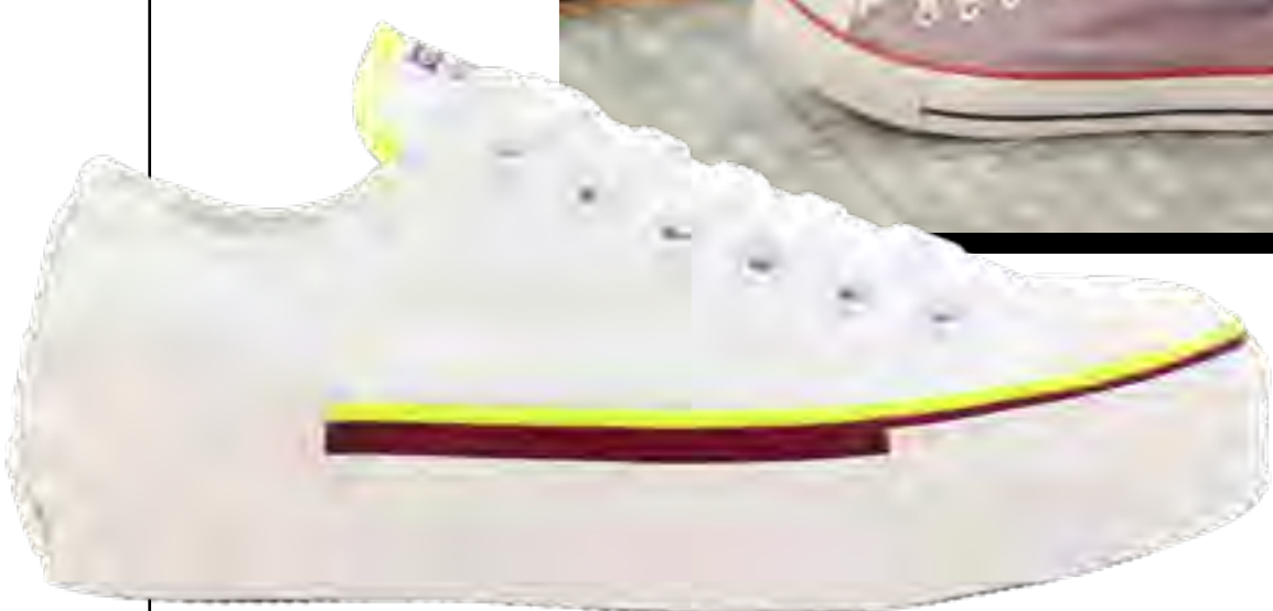
Tênis CONVERSE no IGUATEMI 365

Vestido e bolsa AMISSIMA, moletom e tênis CASA 22, tudo no JK IGUATEMI