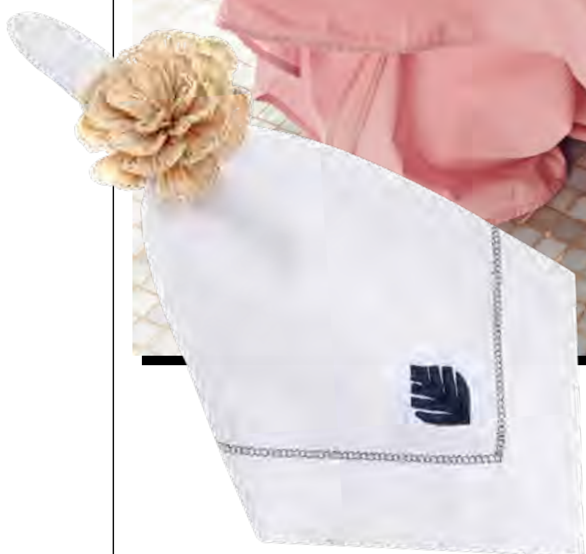
Porta guardanapos TÂNIA BULHÕES no IGUATEMI 365

Malha e saia MAX MARA, brincos e pulseira BETINA DE LUCA e sandálias PAULA TORRES, tudo no IGUATEMI SP