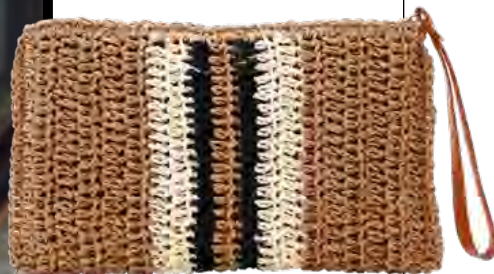
Bolsa LE LIS BLANC no IGUATEMI 365